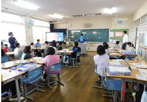
数学科授業のようす