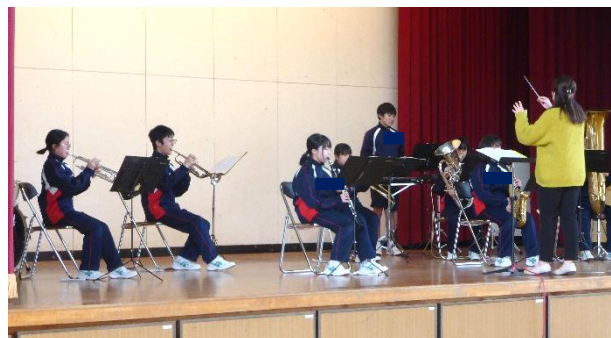
吹奏楽部 「ありがとう」、「ひまわりの約束」を演奏

3月9日(木)に生徒会企画・運営による送別行事を行いました。生徒会長あいさつの後、吹奏楽部の演奏でスタート。3年生引退後、これが1、2年生だけの初舞台でした。緊張も感じられましたが、3年生への感謝の思いが伝わる素敵な演奏を披露してくれました。