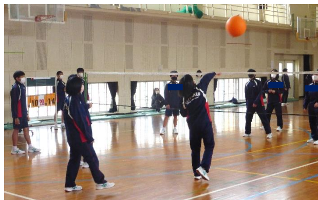
風船バレー 熱い戦い?の後、MVP も発表されました!

心と体があたたまったところで、縦割り班対抗風船バレー大会、みんな笑顔で楽しい時間を過ごすことができました。さらに、ビデオレター、メッセージカードのプレゼント、生徒会副会長の司会進行や終わりの言葉も見事でした。生徒の主体性や表現力の向上もうれしく感じました。