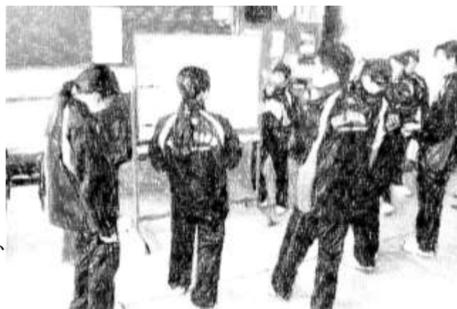
班で協力してクイズやミッションをクリアし、お宝ゲット！

心と体があたたまったところで、 縦割り班対抗宝探しゲーム 、みんな笑顔で楽しい時間を過ごすことができました。さらに、ビデオレター、メッセージカードのプレゼント、生徒会の進行や終わりの言葉、そして、 3年生からのお礼のパフォーマンス も見事でした。 生徒の主体性や表現力の向上 を感じるとてもいい送別行事でした。