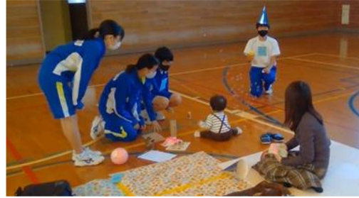
ふれあい体験学習