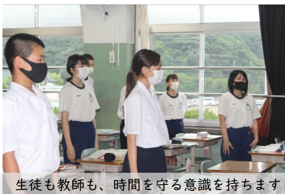
生徒も教師も、時間を守る意識を持ちます