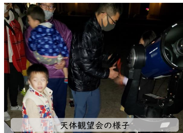
天体観望会の様子