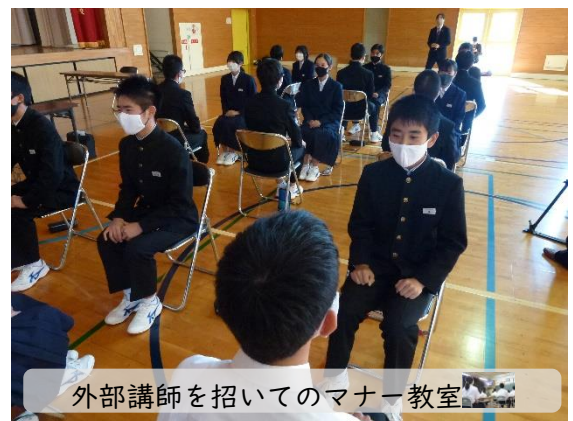
外部講師を招いてのマナー教室