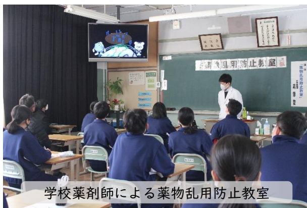
学校薬剤師による薬物乱用防止教室