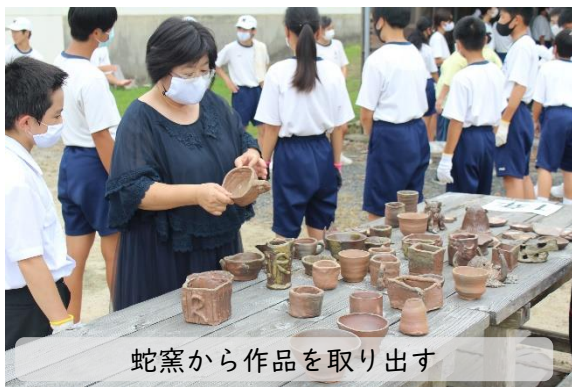
蛇窯から作品を取り出す