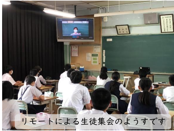
リモートによる生徒集会のようすです