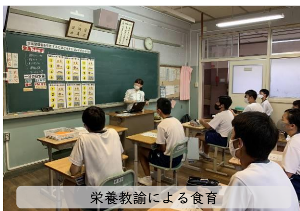
栄養教諭による食育