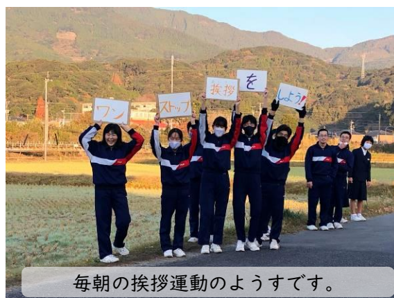
毎朝の挨拶運動のようすです。