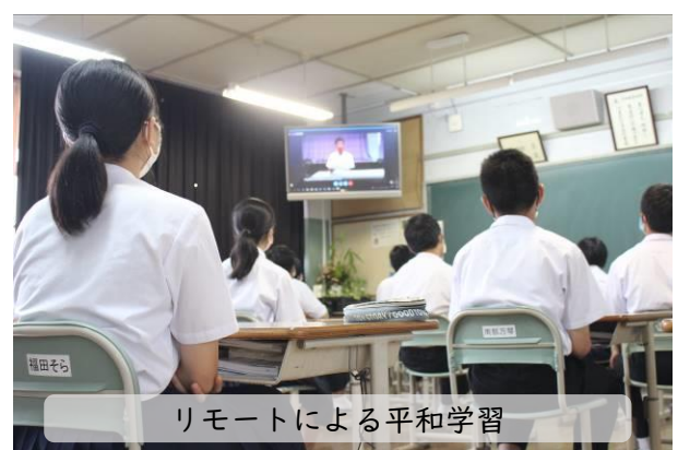
リモートによる平和学習