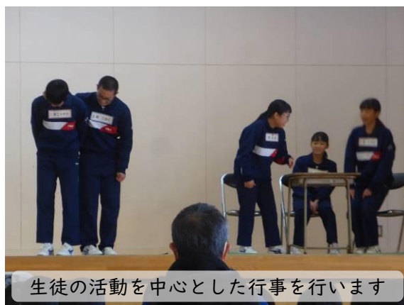
生徒の活動を中心とした行事を行います