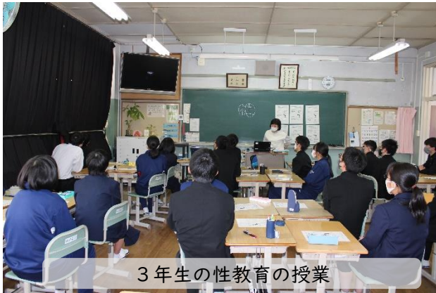
3年生の性教育の授業