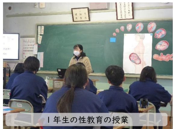
1年生の性教育の授業