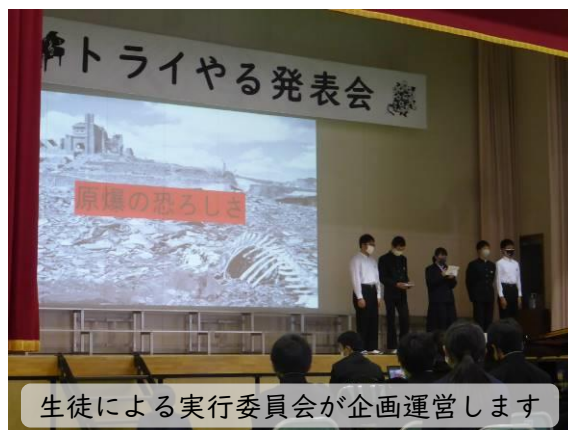
生徒による実行委員会が企画運営します