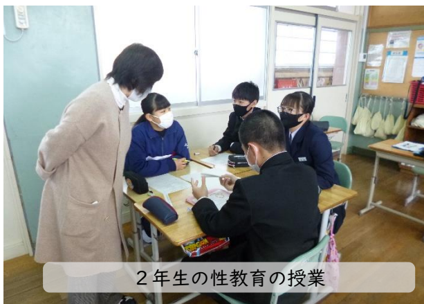
2年生の性教育の授業