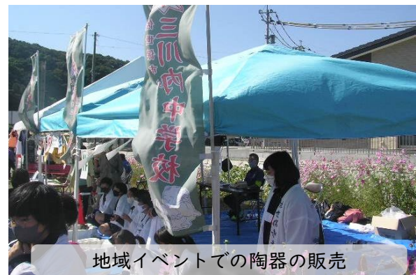
地域イベントでの陶器の販売