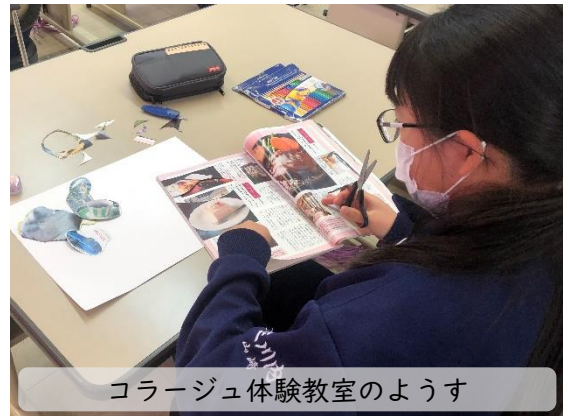
コラージュ体験教室のようす