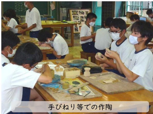
手びねり等での作陶