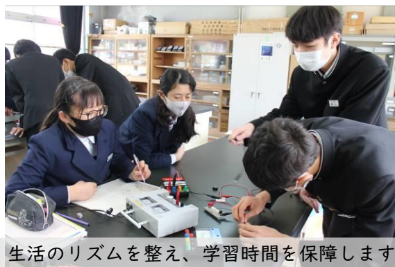
生活のリズムを整え、学習時間を保障します