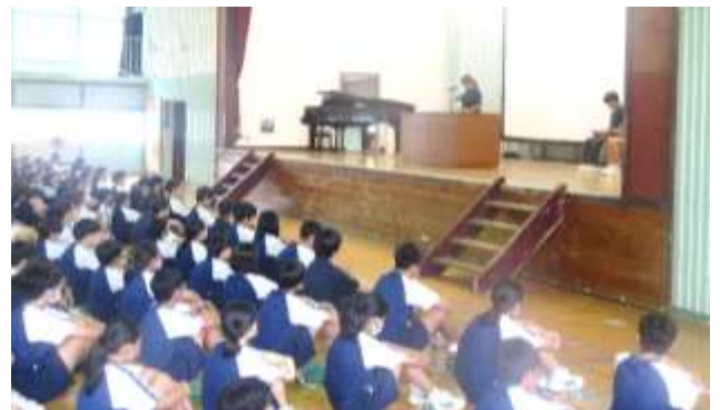
7/19(金)1学期終業式 聞く姿勢がいいです!

2学期は、学年、学級で「合唱コンクール」と「授業前の3・2・1」を頑張りたいです。合唱コンクールでは、体育大会の時みたいにみんなで心をつなげて金賞をとりたいです。授業前の3・2・1は、まだきちんとできているとは言えないので、2学期は完璧にできるように頑張りたいです。