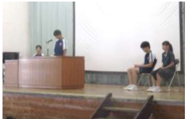
8/27(火) 2学期始業式 代表あいさつのようす

ぼくは2学期になって学級委員になりました。1学期の学級委員を見ていたら、とても大変そうのできるかな？って思ったけど、毎日がんばってる姿を見て自分もやってみたいなと思いました。 学級をまとめるという立場で