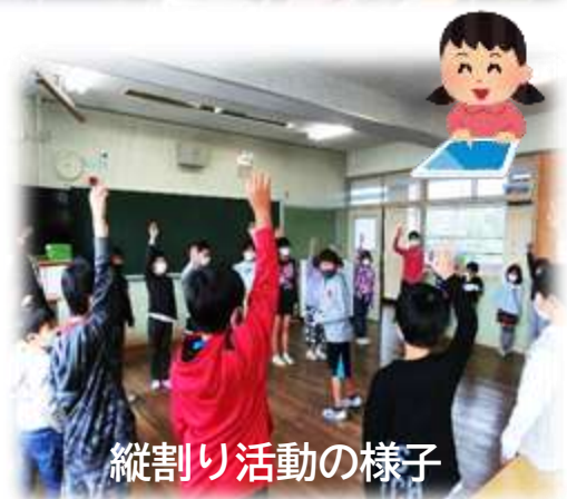
縦割り活動の様子

コロナ禍でリモート化が進みましたが、そればかりでは寂しい気がします。ここ2年、小中の交流だけでなく、縦割り活動やクラブ活動、凧あげなど小学校の学年をこえた交流も縮小・中止を余儀なくされてしまいました。同時に保護者や地域の方々に来校していただく機会も減ってしまいました。次年度こそは、幅広い交流が取り戻せるよう努力してまいりたいと考えています。