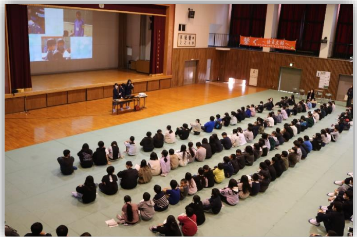
中学2年生と小学5年生の学習交流

間もなく、令和5年度が終わります。今年度も、広田小中学校の教育活動に、ご理解とご協力を賜り、ありがとうございました。次年度も、引き続き、よろしくお願いいたします。