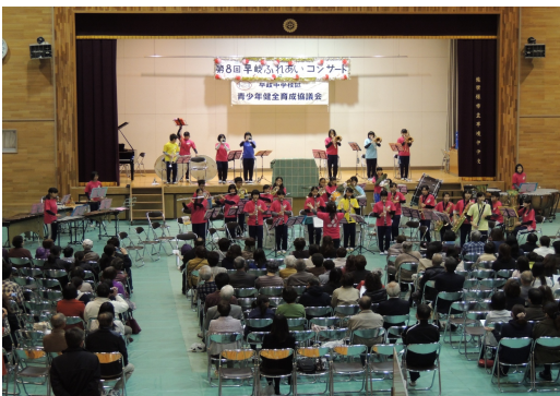
青少年健全育成協議会主催「ふれあいコンサート」(本校吹奏楽部も出演)

このような環境の中で、本市の「特色ある学校づくり対策事業」を有効に活用することにより、本校の教育目標の具現化に努めると同時に、地域・家庭との連携をさらに深めていきたいと考えている。