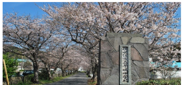
たくさんの生徒達の入学と卒業を見守ってきた早岐中自慢の桜並木

今後も、本校の特色ある取組を通して、『我が早岐を誇りに思う生徒の育成』という教育目標の具現化を推進し、併せて、確かな学力の定着に向けた取組を進めていきたい。