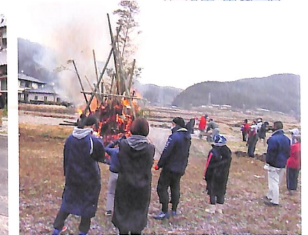
放課後子ども教室