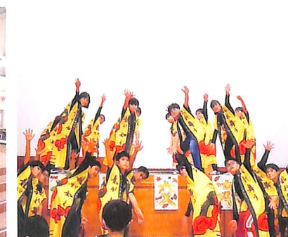
ふるさと交流発表会