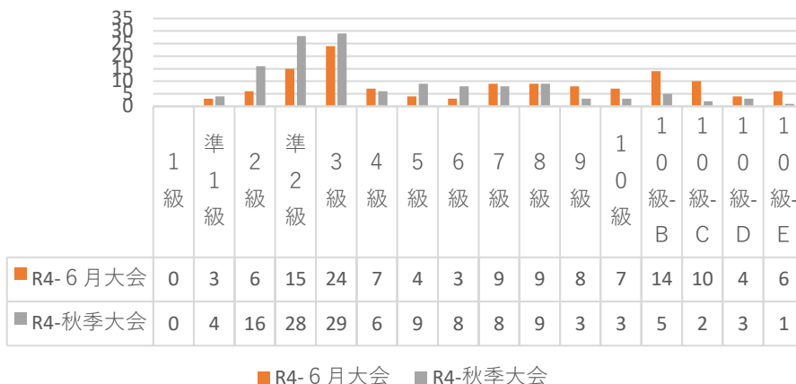
■ R4-6月大会 ■ R4-秋季大会