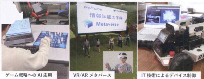
ゲーム戦略へのAI応用

ソフトウェア業界に限らず、あらゆる業界で必要とされるプログラミング技術や人工知能などの知識、高度な情報処理システムを構築するための知識を身につけられます。