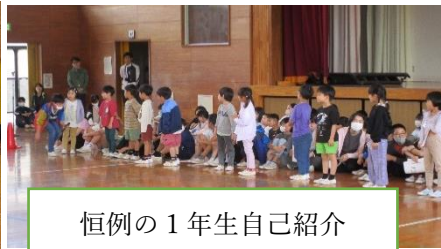
恒例の1年生自己紹介