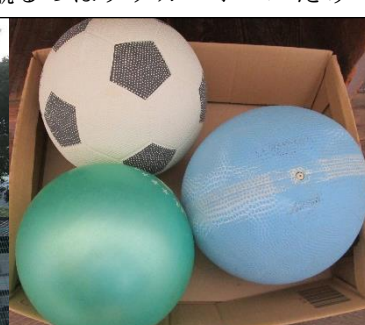
蹴るのはサッカーボールだけ

運動場では、1 水たまりでは遊ばない 2 登り棒等遊具の上には登らない 3 蹴るボールはサッカーボールだけ の約束を確認しました。