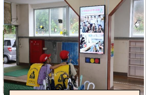
いのちかがやく6月の思い出②

さて、「いのちかがやく強調月間」として、さまざまな取組を実施した6月も終わりました。授業参観や様々な取組へのご協力ありがとうございました。おかげさまで子供たちはたくさんの経験をし、生きているということ・命のことについて考えることができたのではないかと思います。その活動を「いのちかがやく6月②」として、今週からデジタルサイネージで流しています。6月14日～6月27日までの154枚（77スライド）の写真が写し出されています。学校にお越しの際（水泳参観等）は、ぜひご覧ください。いよいよ1学期も、夏休みまで20日足らずとなりました。来週予定されている水泳参観が終わると、1学期のまとめと夏休みに向けて準備をしていきます。