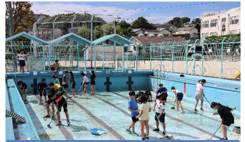
プールが始まります。掃除をしました！

暦は6月となりました。週間予報を見ると、今週はまだ梅雨入りしないようです。明日は、全校で国道植栽を実施する予定ですので、安堵しているところです。さて、6月は「いのちかがやく強調月間」です。痛ましい事件から20年が経ちました。今まで「いのちを見つめる月間」として、保護者や地域の方々と協力しながら、地道に命の大切さについて子供たちと一緒に取り組み、考えてきました。今年は節目として「いのちを見つめる」から「いのちかがやく」にスローガンが変わりました。取組自体は変わらないのですが、子供たちの「いのちかがやく」潮見小学校を目指して、一層丁寧に連携をしていけたらと考えています。(月間の取組は裏面に紹介しています。)