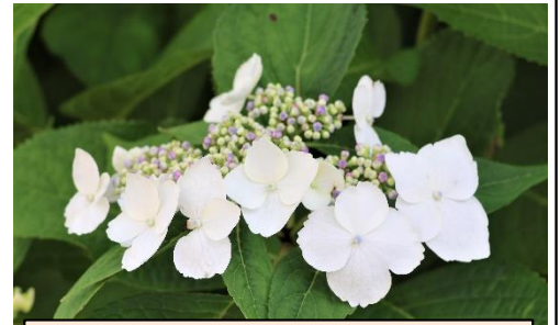
早くもアジサイが咲き始めてます

さて、日曜日は運動会です。不安定なのでしょう、天気予報が日によって変わっています。本番に向けて、子供たちは力を合わせて練習を頑張ってきました。その思いが通じ、運動会が延期されることなく実施できることを強く願っています。そろそろ練習の疲れが出始めている子も見受けられます。まずは「睡眠と食事」。日々の疲れを残さず、暑い日差しに負けないよう、本番に向け体調を整え、子供たちが元気いっぱいのパフォーマンスができることを願っています。