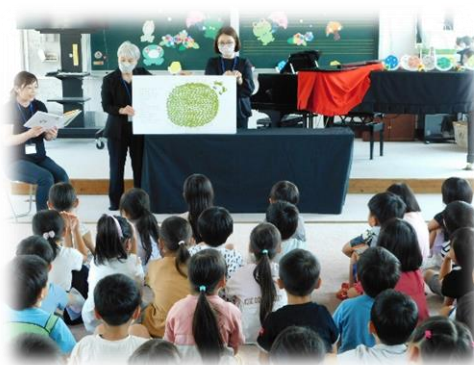
図書ボランティア