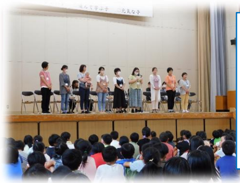
ふれあいボランティア