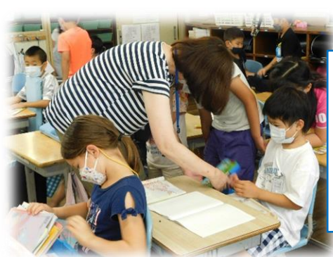
学習ボランティア

毎週月・金曜日の朝に読み語りを実施してもらいました。低学年へのお話会、季節に応じた図書室の装飾・掲示作成等も行っていました。読書に親しむ環境づくりや、読書への興味・関心を高めることができました。