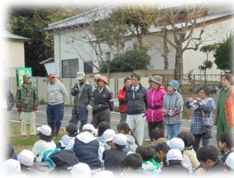
大豆栽培・味噌づくり

毎週月・木曜日の1~3校時後の休み時間、ふれあいルームでボランティアの方々と笑顔で交流する児童の姿をいつも見ることができました。他のボランティア活動同様、大野の地域の力を改めて感じた1年間でした。