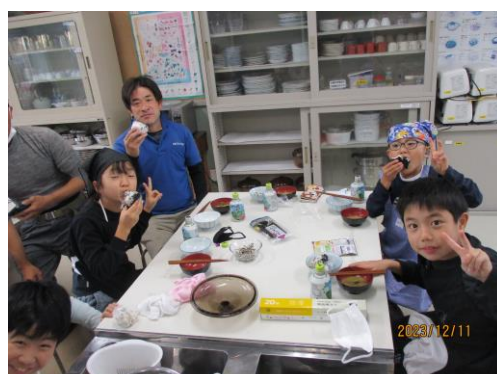
おにぎりパーティー