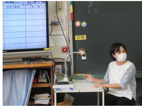
自主学习ふりかえりカード（6年生）