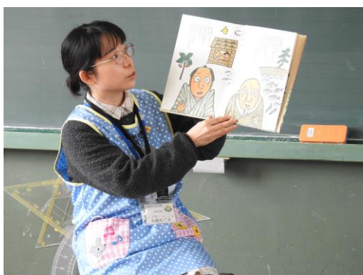
学校司書による読み語り

読書に対する興味・関心を高めるために図書ボランティアの方々と本校職員による朗読劇や図書委員会によるビブリオバトルを行った。