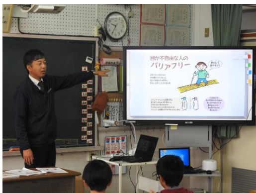
社会福祉協議会と連携した授業

3年生は、社会福祉協議会と連携し、福祉学習に取り組んだ。校外で車いすに乗る活動を行い、目が不自由な人の思いや苦勞を理解することができた。