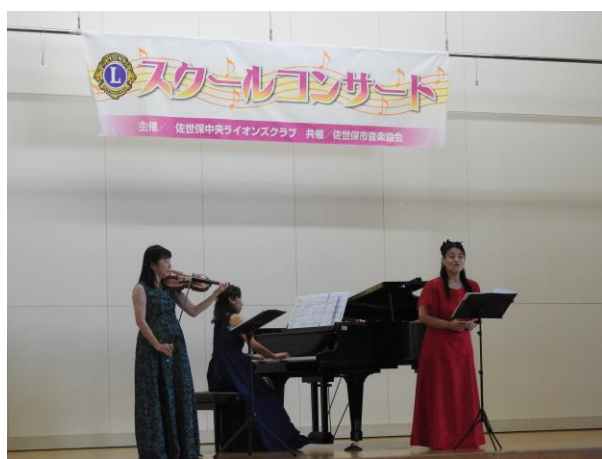
スクールコンサートの様子

佐世保市ライオンズクラブ主催のコンサートを実施した。6年生は、佐世保三曲協会の方々をお招きし、箏や尺八の体験教室を行った。活動を通して、音楽のすばらしさにふれることができた。