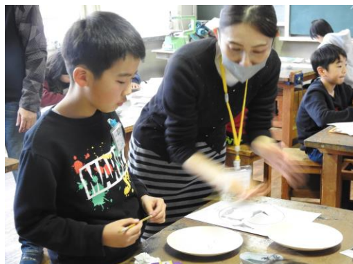
三川内焼絵付け体験