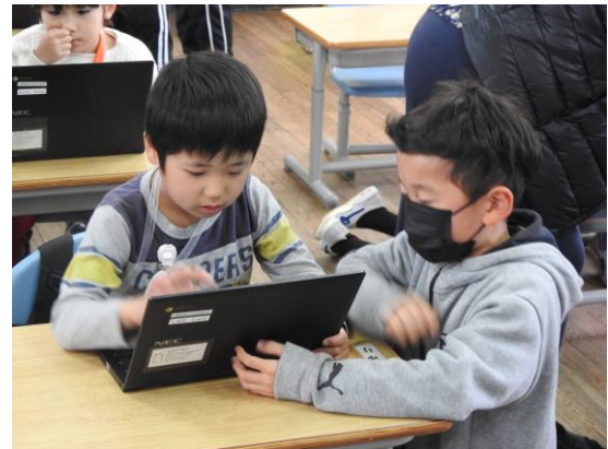
一人一台端末を用いた幼稚園児と1年生の交流