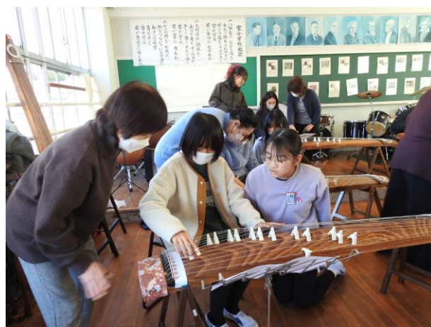
箏・尺八体験教室