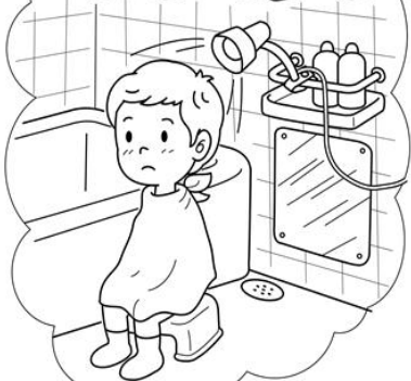
風呂場、ベランダなどにイスを置き、首から下を風呂敷などでおおい、電気スタンドで照らします。