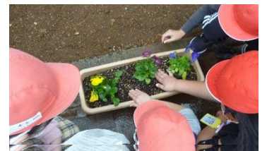
【たてわり花植え活動】