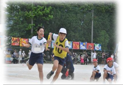
勝負を決めた！色別対抗リレー