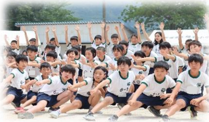
5・6年：ソーラン節 決めポーズ