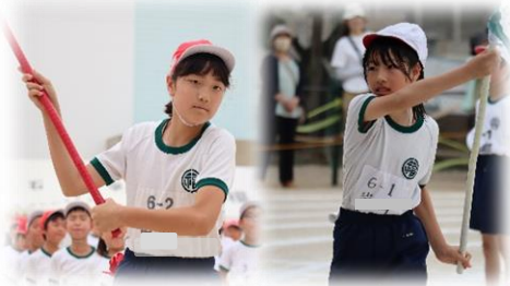
今年の応援団長は女子対決！声もよく出ていました

運動会をとおして学んだことを、これからの学校生活に生かしていけるよう指導してまいります。