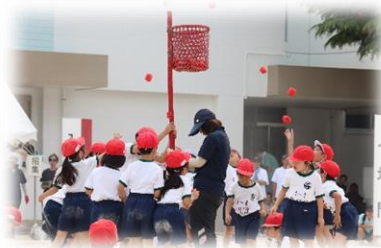
1・2年：玉入れ「30...40...たーくさん」