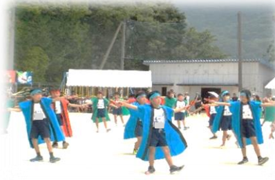
3・4年：回って跳んでけんか独楽