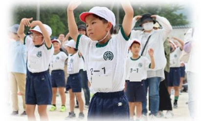
みんなで踊った「つばめ」