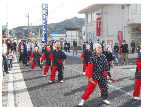
4～6年生「浮立道行披露」