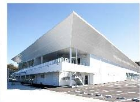
佐世保クルーズセンター