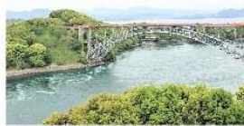
西海橋(国重要文化財)