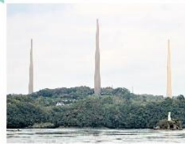
針尾無線塔(国重要文化財)