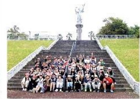
浦頭引揚記念公園