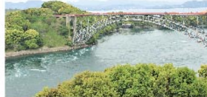
西海橋(国重要文化財)