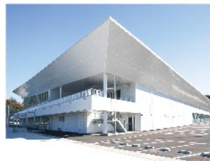
佐世保クルーズセンター