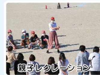
親子レクリエーション