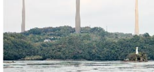
針尾無線塔(国重要文化財)