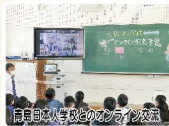
青島日本人学校とのオンライン交流