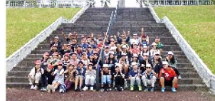
浦頭引揚記念公園