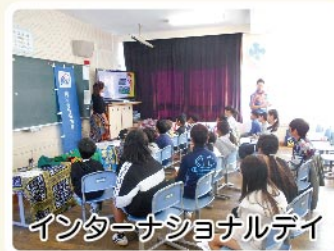
インターナショナルデー