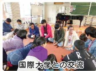
国際大学との交流