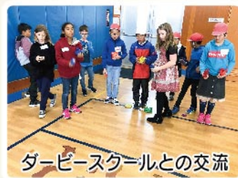
ダービースクールとの交流