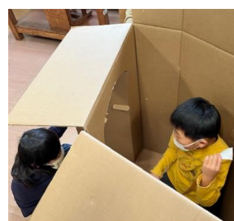
1・2年生 段ボールのおうち作り

前期課程の個性が光る、多くの作品を展示しています。今月28日は授業参観です。是非こうした作品もご覧いただきたく思います。様々な道具の使い方を学び、創作することが楽しい様子です。