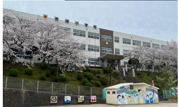
【満開の桜と校舎；令和6年4月2日撮影】