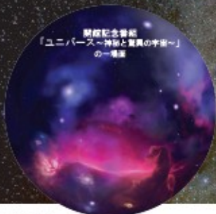
開館記念番組 「ユニバース～神妙と真実の宇宙～」 の一場面

面積122.25㎡(ドーム径9m) 定員約65名 デジタル式全天周投影機「バーチャリウムⅡHD」