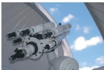
主鏡 20cm屈折式望遠鏡 副鏡 13cm屈折式望遠鏡×2 惑星自動撮影・撮像・静止撮影 12cm屈折式望遠鏡×2 太陽観測・太陽観測・撮影

少年科学館のプラネタリウムと天体観測室は、子どもたちの学習の場としてだけでなく、一般にも公開しています。大人も子どもも楽しめる内容となっていますので、多数ご来場ください。